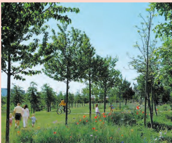
Dés logements avec de larges terrasses donnant sur les cours de verdure.