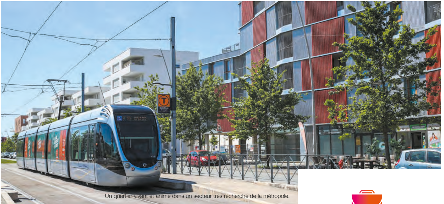
Un quartier vivant et animé dans un secteur très recherché de la métropole.