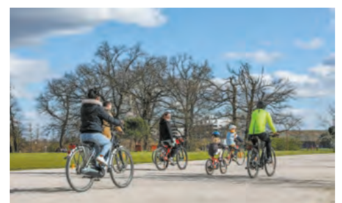
Un environnement généreux en espaces verts, pistes cyclables et cheminements piétons