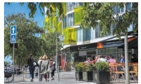
L'avenue Andromède compte de nombreux commerces

• Participez à la concertation avec les habitants et usagers, pour co-construire un quartier agréable (balades urbaines, ateliers participatifs, concertation sur les futurs espaces publics de la dernière phase).