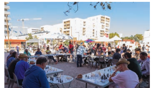
La Ville de Toulouse, le centre culturel La Brique Rouge et les associations locales ont animé le quartier durant tout l'été 2022 !

• Déplacez-vous facilement et rapidement grâce à une offre de transports en commun complète (train, métro, bus, vélo) et un accès direct au périphérique.