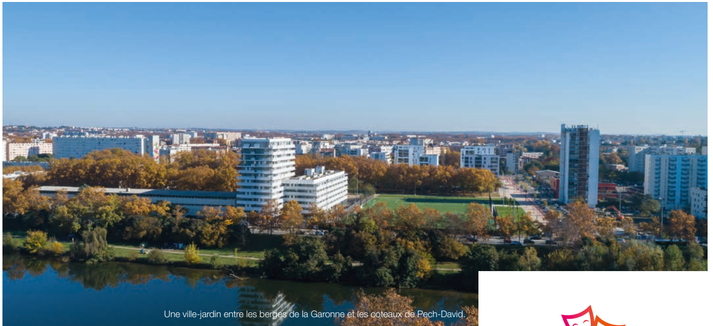
Une ville-jardin entre les berges de la Garonne et les coteaux de Pech-David.