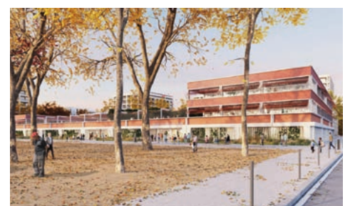
Un nouveau groupe scolaire sera construit regroupant maternelle et élémentaire.