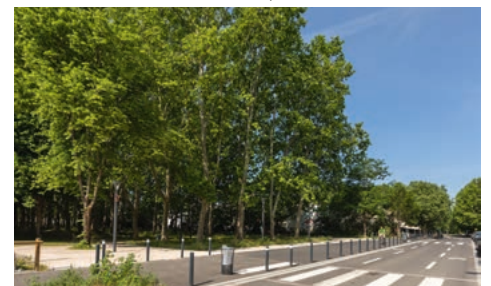
La nouvelle rue de Toulon ouvre le quartier vers la Garonne