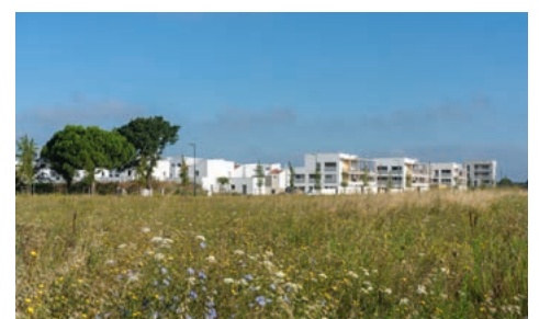
La prairie fleurie fait le lien entre Laubis et la Garonne