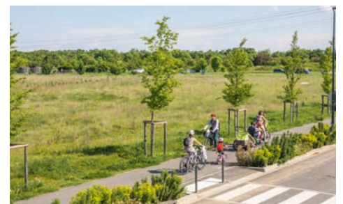
De nombreuses pistes cyclables et cheminements piétons créés

• Découvrez les bonnes pratiques respectueuses de l'environnement, rejoignez les jardins potagers partagés