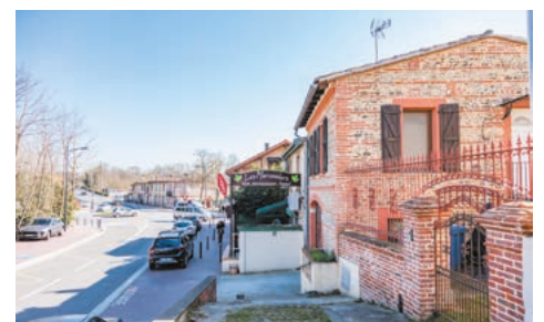
Un centre-bourg aux allures de village typique de la région.