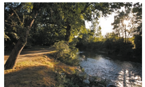
Le cadre bucolique de la coulée verte des berges du Touch

• Devenez acteur de la construction du quartier, en participant aux ateliers de concertation ou aux balades urbaines. Et bientôt des projets d'urbanisme transitoire pour animer le quartier.