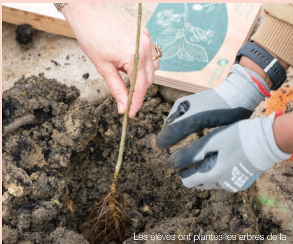
Les élèves ont plantés les arbres de la future aire de jeux à côté du groupe scolaire G. Mailhos.