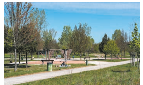
Le parc de la Marcaissonne, 10 ha de poumon vert à Toulouse.

• Imaginez votre quartier , grâce aux ateliers de participation citoyenne. La place centrale et les jeux pour enfants à côté de l'école ont été réalisés avec les habitants.