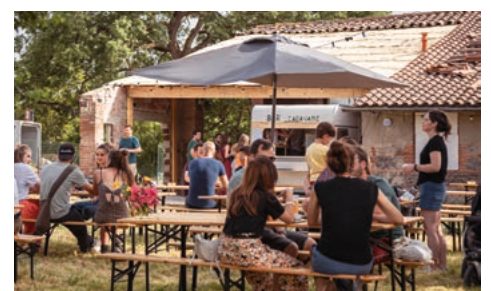
La Maison Malepère, guinguette éphémère, s'est ouverte en mai 2022.