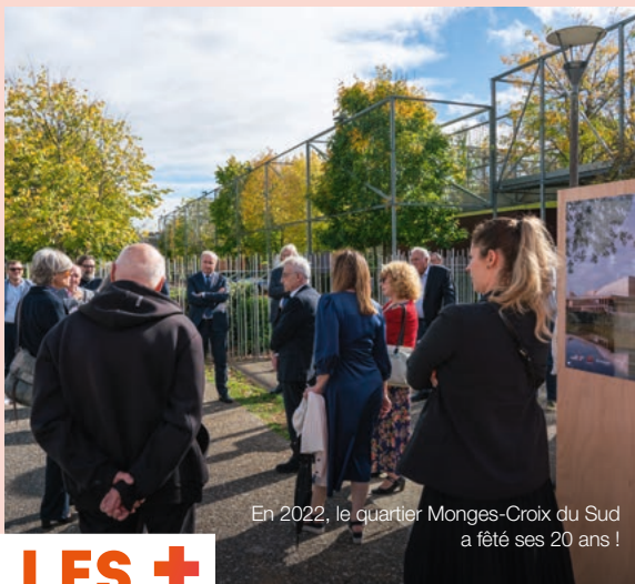
En 2022, le quartier Monges-Croix du Sud a fêté ses 20 ans !